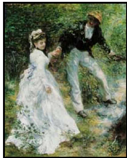
("El paseo", 1870)

Nacido en Limoges en 1841, Renoir se sintió atraído tempranamente por el arte, y trabajó en una fábrica de porcelanas y después pintando abanicos, al mismo tiempo que estudiaba en la Escuela de Diseño y Artes Decorativas. Su pasión por la pintura le hizo titularse con éxito en la Escuela de Bellas Artes y participar en los cursos que el pintor suizo Charles Gleyre impartía en su taller. Allí fue donde conoció a los que fueron sus amigos y compañeros de viaje, Sisley, Monet y Bazille.