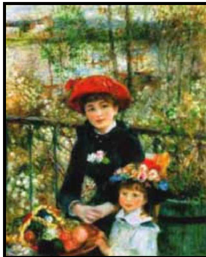
(“En la terraza”, 1881)

El periodo impresionista de Renoir estuvo marcado por sus numerosos paisajes y por las excepcionales escenas costumbristas, donde supo retratar como nadie la alegría de vivir de aquellos que sabían ser felices con lo poco que tenían. En 1880, se enamoró de Aline Charigot, la dulce muchachita del perro en su “Almuerzo de remeros”, 20 años menor que él, que le dio tres hijos, Pierre, Jean y la pequeña Claude (Coco) y con la que vivió una vida tan apacible como su arte.