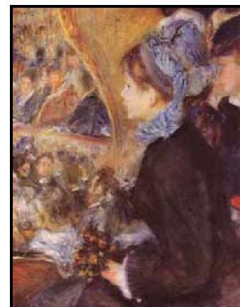
("En el teatro", 1876)

Con el fin de paliar los efectos de su artritis, Renoir viajó con frecuencia a tomar baños termales y otros tratamientos en Cagnes-sur-Mer y a Essoyez, tratando de huir del crudo invierno en la templada Costa Azul. Esta carta está fechada en Cagnes en 1909, cuando pintor ya padecía su enfermedad de una forma muy acusada y, sin embargo, no deja de imprimir en el papel la fuerza y la querencia optimista que tanto le caracterizaba. La torpeza del gesto trazado por unos dedos anquilosados y rígidos, no impide que los puntos de las ias sigan alzando su vuelo y que las formas pretendan bailar. Parecía tener Renoir las ideas claras y ser y mantenerse firme en sus propósitos guiado siempre por una sabia intuición. De natural afectuoso y afable, no por ello dejaba de mostrar su impetuoso espíritu también en cierto rictus autoritario y, en ocasiones, rebelde. Quizás fue esta tendencia "revolucionaria" lo que le hizo removerse contra las formas imperantes en la época y lanzarse a innovar y a experimentar nuevas técnicas en su arte.