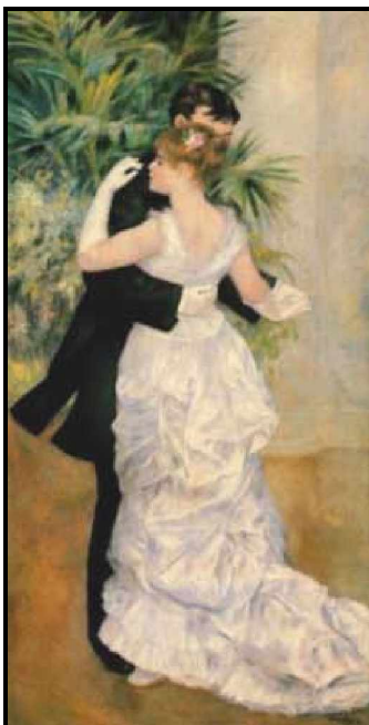
"Baile en la ciudad"