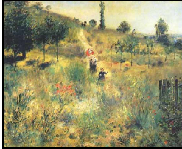
(“Camino cuesta arriba entre las hierbas altas”, 1873)

El periodo impresionista de Renoir estuvo marcado por sus numerosos paisajes y por las excepcionales escenas costumbristas, donde supo retratar como nadie la alegría de vivir de aquellos que sabían ser felices con lo poco que tenían. En 1880, se enamoró de Aline Charigot, la dulce muchachita del perro en su “Almuerzo de remeros”, 20 años menor que él, que le dio tres hijos, Pierre, Jean y la pequeña Claude (Coco) y con la que vivió una vida tan apacible como su arte.